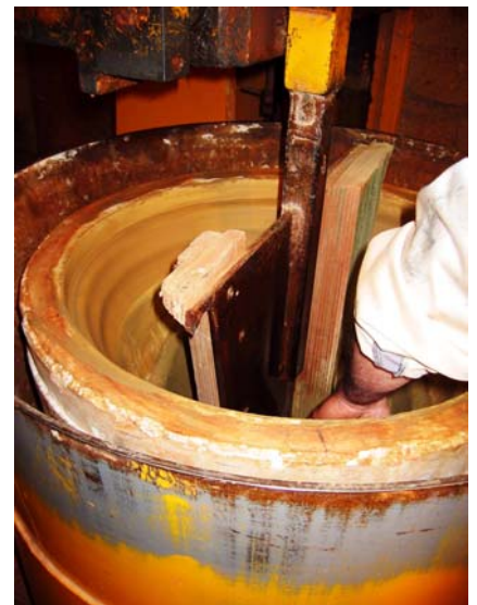
tournage du pot