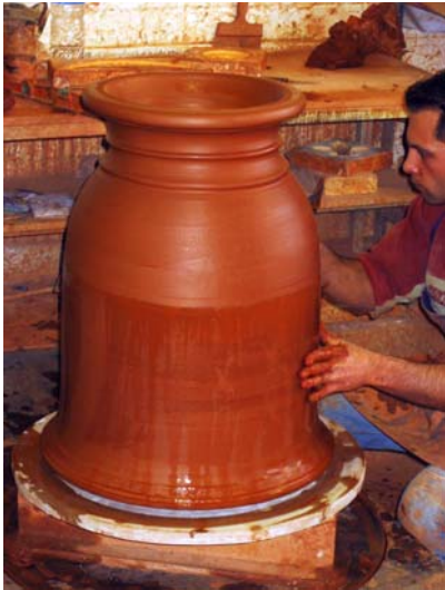
préparation du pot avant fixation des motifs