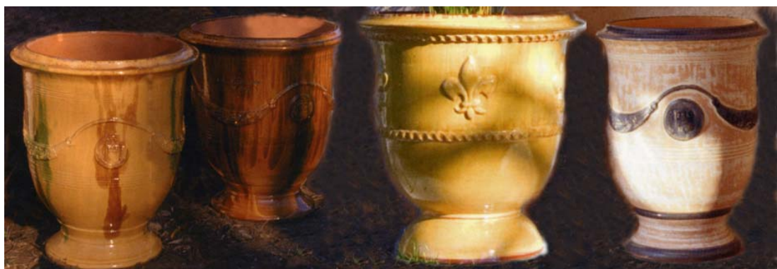
Visite du magasin d'exposition-vente - achats