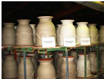
vases avec motifs enduits d'un fondant, en attente de glaçure