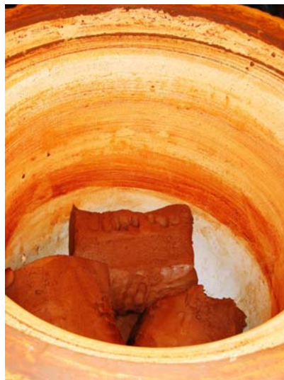
moule avec les "pains" de terre-glaize pour la fabrication des pots (terre importée d'Espagne)