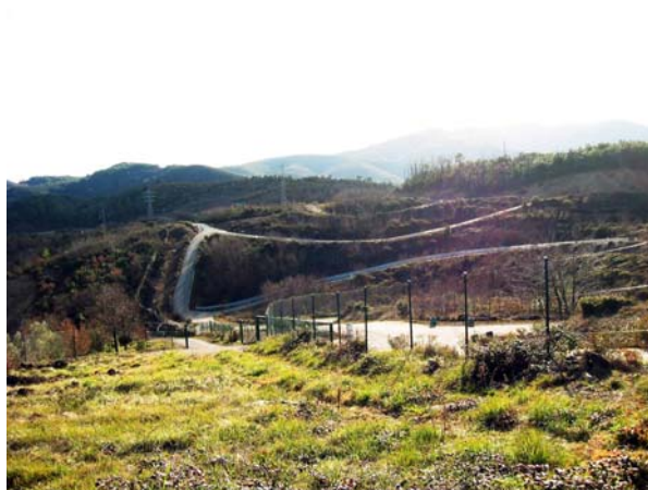
circuit de rallye