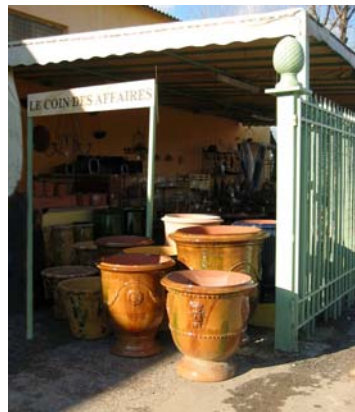
entrée de la poterie