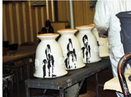
Coulées d'oxydes métalliques pour l'obtention d'un "flammé" après cuisson. Le pot sera recouvert ensuite d'un autre oxyde de teinte grisâtre uniforme (à droite de la photo)