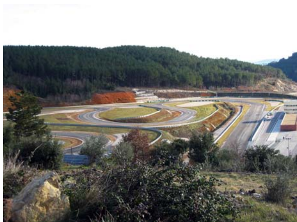
circuit de vitesse

Piste de karting - circuit de vitesse - circuit de rallye