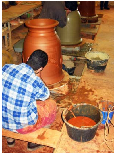
"collage" des motifs