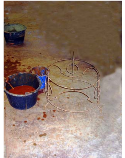
gabarit de positionnement des motifs