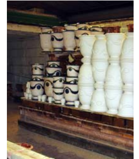
Entrée dans le four d'un lot de pots